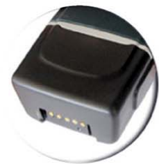
เชื่อมต่อได้ทันที ไม่ว่าจะตั้งข้อมูล หรือขาดรหัสลังงาน