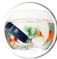
ทนทาน กันน้ำได้